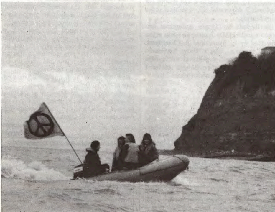
GWEITHREDU AR Y MÔR - "I'r cychod!" oedd hi pan ymweleodd y llong ryfel HMS Jupiter, a all gario arfau niwclear, â Chaerdydd ym mis Ionawr. Daeth ymgyrchwyr heddych yn agos at y llong ger Penarth. Gwel. tud. 2.